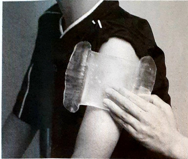
「タナック」の適用イメージ