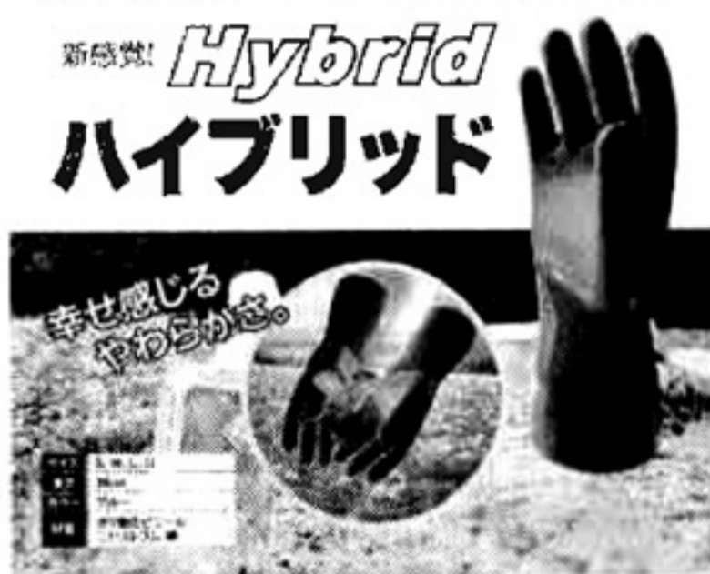
新感覚! Hybrid ハイブリッド