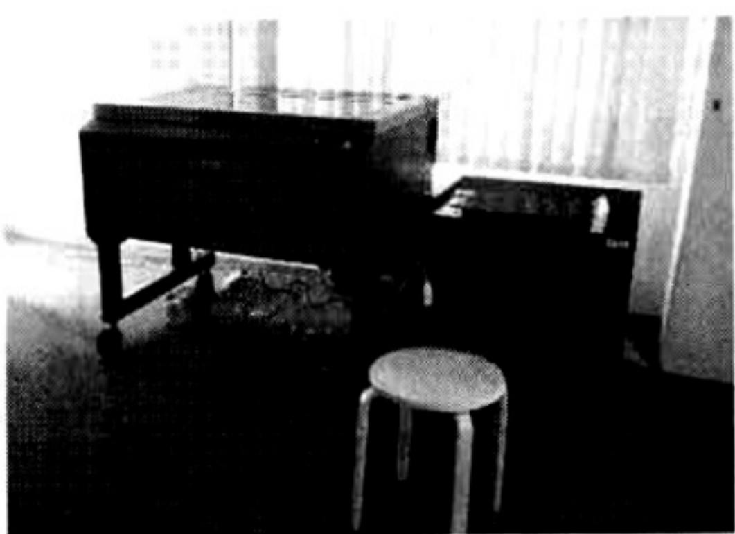
レーザーカッター

会員制だが、ビジターでの一時利用も可能。フェイスブックやツイッターでPRしての反応はオーマ界したという。目途に単独で果たしたい」と