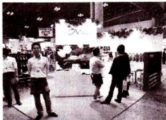
東和コーポレーション