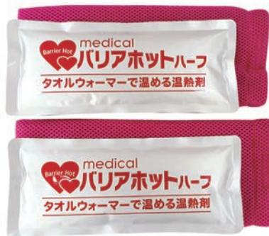
バリアホット・ハーフ