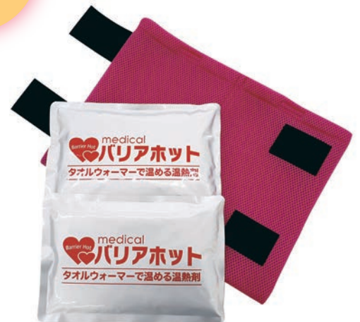
バリアホット・ダブル