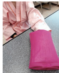
筒状にして手を入れて